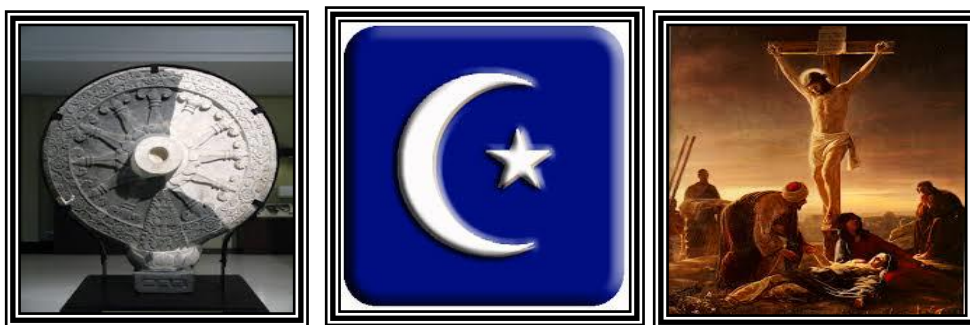
ภาพที่ 1.10 สัญลักษณ์ของศาสนา

6. สัญลักษณ์ ทุกศาสนามีสัญลักษณ์ซึ่งใช้เป็นสื่อหรือเครื่องหมายแทนศาสนา เช่น ศาสนาพุทธมีสัญลักษณ์เป็นธรรมจักร ศาสนาคริสต์มีสัญลักษณ์เป็นไม้กางเขน ศาสนาอิสลามมีสัญลักษณ์เป็นรูปพระจันทร์เสี้ยวและดวงดาว