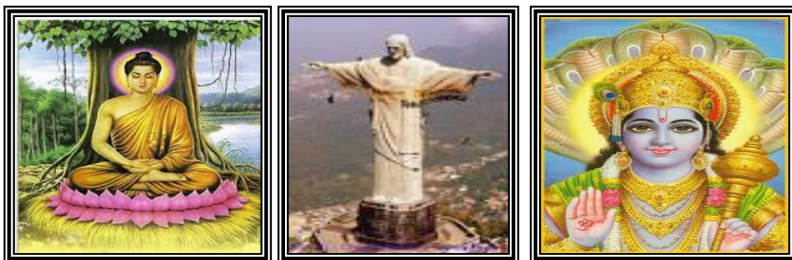
ภาพที่ 1.6 ศาสนาของศาสนาต่างๆ

1. ศาสนา ได้แก่ ผู้ให้กำเนิดศาสนาหรือผู้สอนดั้งเดิม เช่น พระพุทธเจ้าทรงเป็นศาสดาของพุทธศาสนา พระเยซูเป็นศาสดาของคริสต์ศาสนา แต่บางศาสนาก็ไม่ปรากฏว่าใครเป็นศาสดา เช่นศาสนาพราหมณ์ หรือศาสนาฮินดู