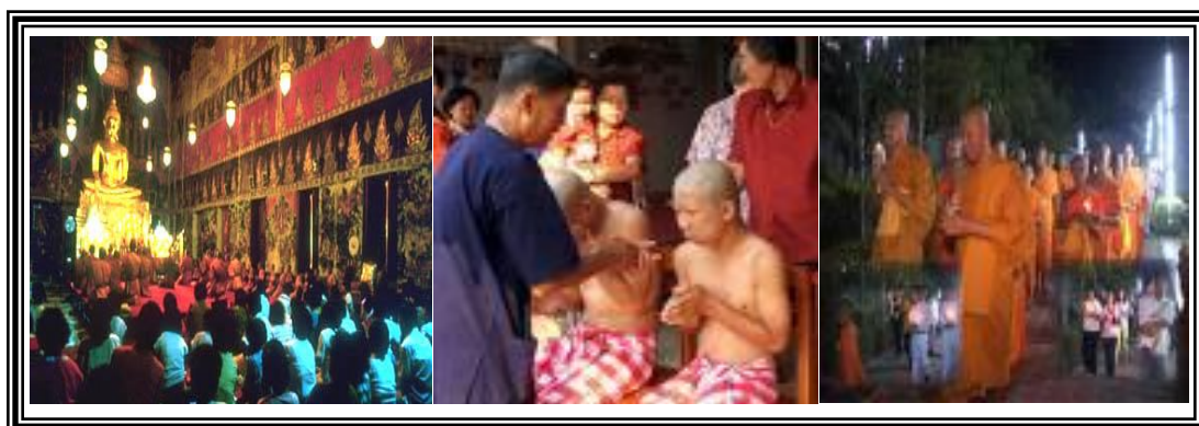
ภาพที่ 1.2 พิธีกรรมทางศาสนา

3. เกิดจากความจงรักภักดี ซึ่งเป็นศรัทธาครั้งแรกที่มนุษย์ทุกยุคทุกสมัยยอมเชื่อว่าเป็นกำลังก่อให้เกิดความสำเร็จได้ทุกเมื่อ ในกลุ่มศาสนาที่นับถือพระเจ้า (ศาสนายิว ศาสนาคริสต์ ศาสนาอิสลาม) มุ่งเอาความภักดีต่อพระเจ้าเป็นหลัก ทางพระพุทธศาสนาก็ยอมรับว่าศรัทธา หรือความเชื่อ ความเลื่อมใสเท่านั้นที่จะ พาข้ามโสมงสารได้ เมื่อเป็นดังนี้แสดงว่ามนุษย์ยอมตนให้อยู่ใต้อำนาจของธรรมชาติเหนือตน อันเป็นสิ่งที่มนุษย์สร้างขึ้นเอง หรือพระเจ้า อย่างไรก็ตามผลที่เกิดตามมาคือมนุษย์ยอมให้เครื่องสังเวทแก่ธรรมชาตินั้น ๆ ด้วย ลักษณะนี้จึงเท่ากับมนุษย์เสียความเป็นใหญ่ในตน ยอมอยู่ใต้อำนาจของสิ่งที่ตนคิดว่ามีอำนาจเหนือตน