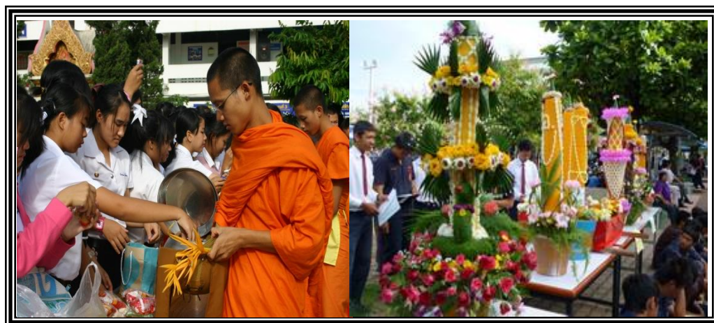
ภาพที่ 1.3 ขนบธรรมเนียมประเพณี

5. เป็นพื้นฐานของขนบธรรมเนียมประเพณี เพราะหลักธรรมคำสอนต่างๆ ของศาสนา ที่ประชาชน ในสังคมถือปฏิบัติมานั้น มีการสืบทอดกันมายาวนาน กลายเป็นขนบธรรมเนียมและประเพณีของสังคม ที่จะยึดถือปฏิบัติ เช่น การทำบุญตักบาตร การไหว้พระ การเวียนเทียนในวันสำคัญทางศาสนา เป็นต้น