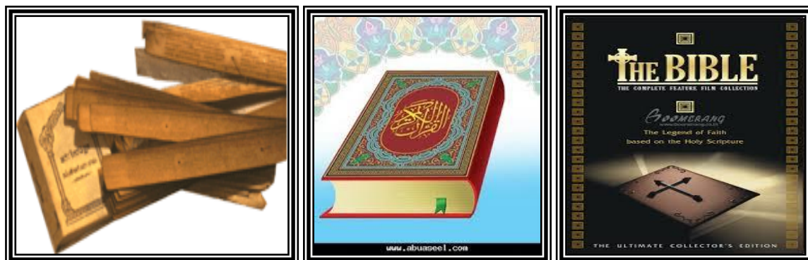
ภาพที่ 1.7 หลักธรรมคำสอนของศาสนาต่างๆ

2. หลักธรรมคำสอน หมายถึง ข้อปฏิบัติที่มนุษย์ใช้เป็นแนวทางในการดำเนินชีวิตที่ดีงาม เช่น พระเวท เป็นคัมภีร์หลักของศาสนาพราหมณ์ พระไตรปิฎกเป็นคัมภีร์หลักของพระพุทธศาสนา พระคัมภีร์เดิมเป็นคัมภีร์หลักของศาสนาユดาเยและศาสนาคริสต์ เป็นต้น