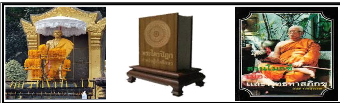
ภาพที่ 1.5 ศาสนาเป็นศูนย์รวมจิตใจของคน และให้ยึดหลักธรรมคำสอนเป็นเครื่องยึดเหนี่ยวจิตใจ