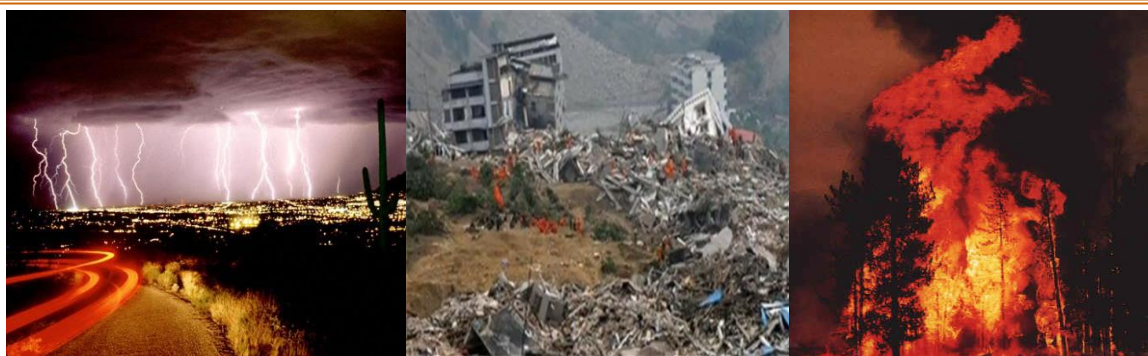
ภาพที่ 1.1 ปรากฏการณ์ทางธรรมชาติ

มนุษย์ในสมัยดึกดำบรรพ์ได้ประสบกับปรากฏการณ์ธรรมชาติต่างๆ ซึ่งเป็นทั้งความกลัวและมหัศจรรย์สำหรับตัวมนุษย์ เช่น ความมืด ความสว่าง พายุพัด ฟ้าแลบ ฟ้าผ่า แผ่นดินไหว ไฟป่า เป็นต้น และด้วยความที่ไม่มีความรู้เกี่ยวกับปรากฏการณ์เหล่านั้น มนุษย์จึงเกรงกลัวปรากฏการณ์ธรรมชาติต่าง ๆ ที่เกิดขึ้น