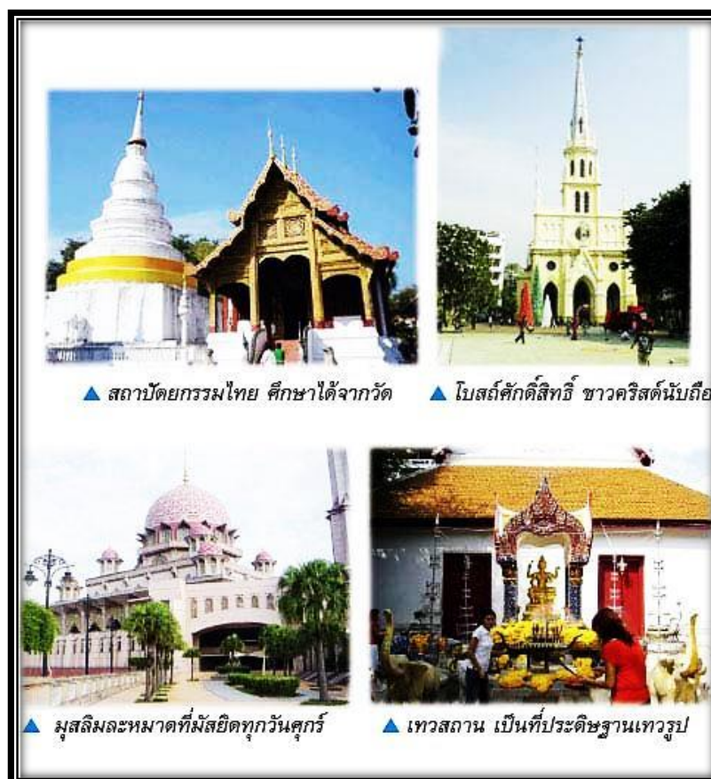
ภาพที่ 1.4 ศาสนามีศาสนสถานและศาสนพิธีเป็นมรดกทางสังคม

ศาสนาจึงมีความสำคัญต่อบุคคล สังคม ในสังคมไทยจะไม่มีกรกีดกันศาสนาอื่นๆ พร้อมทั้งให้การสนับสนุนและส่งเสริมศาสนาต่างๆ