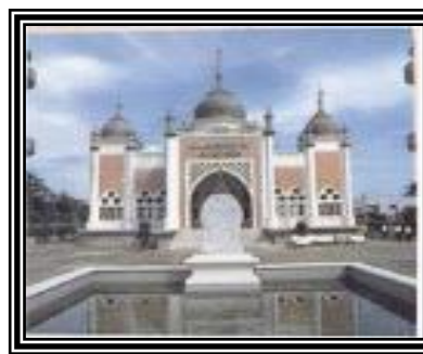
ภาพที่ 1.9 ศาสนสถาน ของศาสนาที่สำคัญ

สืบค้นจาก https://chaiyanann.wordpress.com/ เมื่อวันที่ 10 พ.ย. 2557