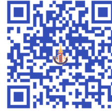
แบบรายงานตัวยืนยันสิทธิ์หรือสละสิทธิ์

สแกน QR Code เพื่อการรายงานตัวยืนยันสิทธิ์การเข้าเรียน โรงเรียนวิทยาศาสตร์จุฬาราชวิทยาลัย มุกดาหาร ชั้นมัธยมศึกษาปีที่ 4 ปีการศึกษา 2568