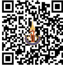
ช่องทางรายงานตัวและยืนยันสิทธิ์